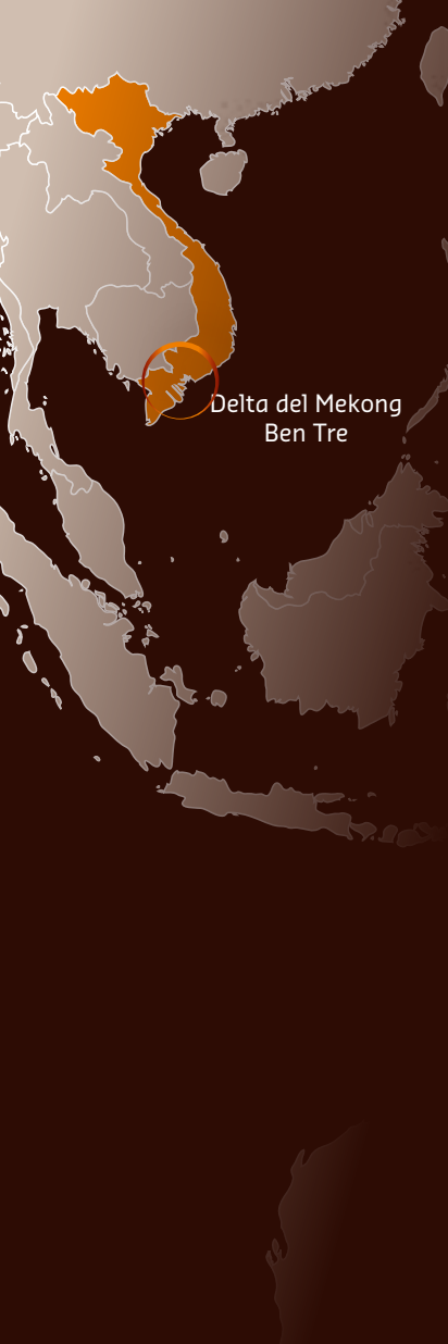
Delta del Mekong Ben Tre