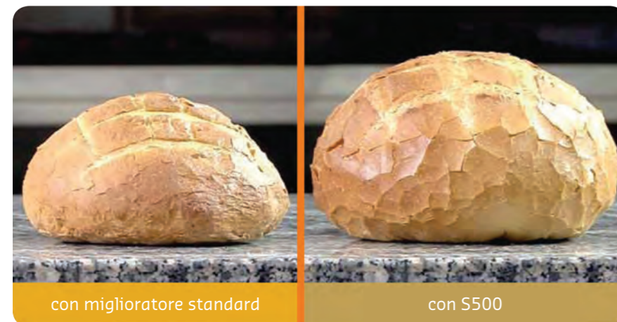
Con S500 : Volume eccellente e forma regolare

In condizioni standard miglioratori differenti possono dare qualità simili; ma cosa succede quando le condizioni di panificazione non sono ottimali? In queste situazioni S500 non ha eguali!